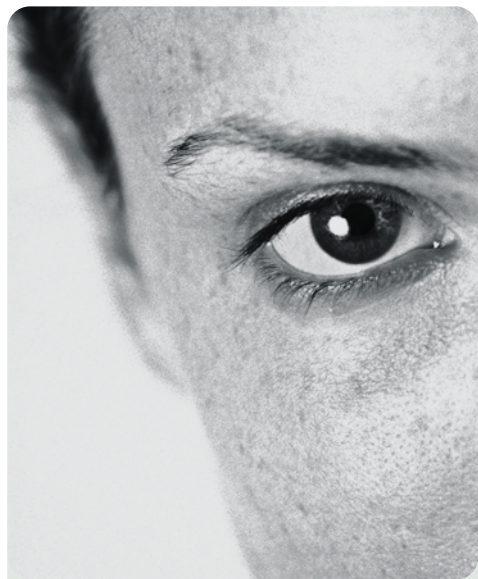
Ab UV-Index Stufe 3 sollten wir eine Sonnenbrille tragen, ab Stufe 6 müssen wir.

Die Schneeblindheit wird in der Medizin als „Aktinische Keratopathie“ bezeichnet. Ursache ist eine Schädigung der äußeren Hornhaut des Auges. Freiliegende Nervenenden zeigen sich durch starke Schmerzen, extreme Lichtempfindlichkeit, Tränenfluss, gerötete Augen und Fremdkörpergefühl im Auge. In leichteren Fällen heilt die Schneeblindheit in bis zu drei Tagen aus, in schwereren können irreparable Sehschäden bleiben. Als Sofortmaßnahmen empfehlen sich Abdunkelung und Kühlen der Augen mit einem feuchten Tuch, der Arztbesuch ist ein Muss. ■