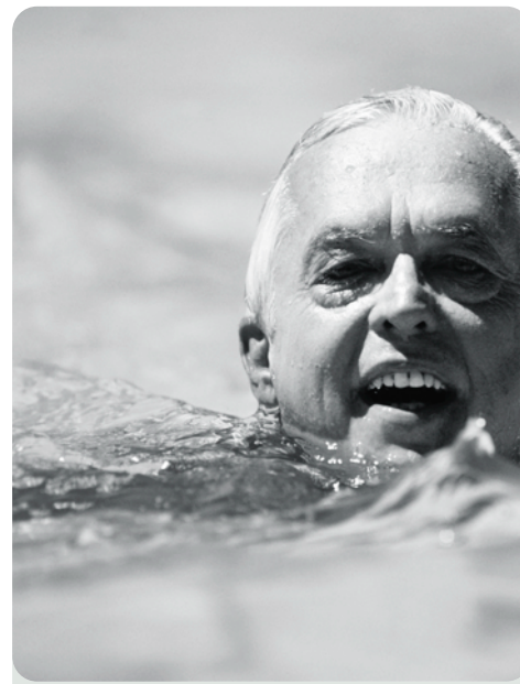
Eine Viertel Stunde Bewegung am Tag hält auch das Oberstübchen fit.

Regelmäßiges Training schützt vor geistigem Abbau. Wer Körper und Geist fordert, hält sie auch länger fit, sagt eine US-Studie. Australische Forscher meinen, Fernsehen macht uns den Lebensabend madig.