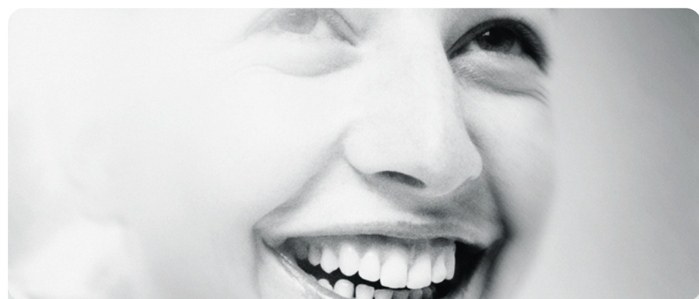
„Lachen ist gesund“ – eine Volksweisheit, belegt durch neue Forschungen, eine Minute bringt 45 Minuten Entspannung, bis zu 300 Muskeln werden pro Lachen aktiviert.

Lachen fördert die Durchblutung Mindestens 15 Minuten lachen am Tag wirkt sich gut auf die Blutgefäße aus und lässt unser Blut besser zirkulieren. Eine „provokative Therapie“ wird in München mit „Seelenheil durch Lachen“ angeboten.