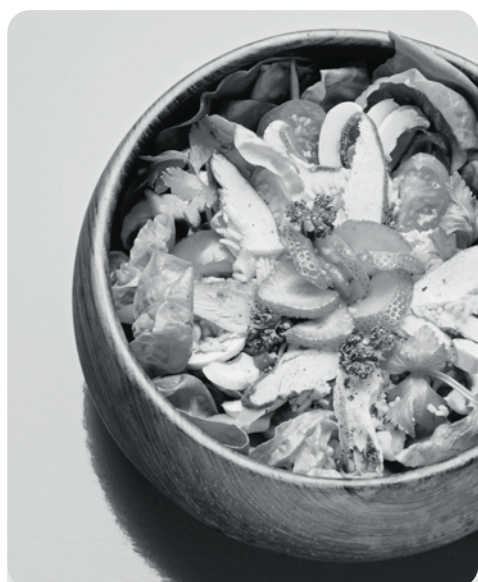
Änderung der Ernährung soll das psychische Übel bei der Wurzel packen.

Weniger frische Lebensmittel, Gemüse und Fisch führen in unserer Gesellschaft zu immer mehr Depressionen, Schizophrenie und Alzheimer. Geistige Gesundheit und Ernährung hängen eng zusammen.