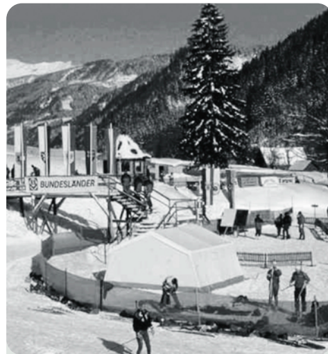
Mit dieser organisatorischen Klasseleistung könnte bald ein Weltcup-Bewerb winken.