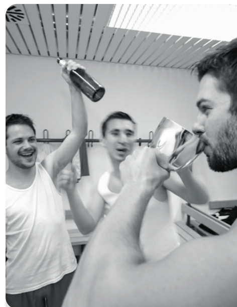
Die durchschnittlichen FreizeitsportlerInnen sündigen gerne, oft sogar direkt danach.

führt, mehr als 7.000 Versuchspersonen wurden getestet. Nach dem Studienergebnis ist das Verhalten unter den SportlerInnen keineswegs „gesundheitsbewusst“. Viele rauchen, trinken regelmäßig Alkohol und zeigen wenig Verständnis für gesunde Ernährung, trotz regelmäßigen Sports. Bezüglich des Themas „Rauchen“ geht unterdessen die EU-weite Kampagne „HELP – für ein rauchfreies Leben“ in ihr zweites Jahr. 2005 liefen über 4.000 TV-Werbespots auf mehr als sieben nationalen und europaweiten Kanälen. Mit der Ausstrahlung der Spots erreichten die Verantwortlichen 700 Millionen EU-BürgerInnen im Alter von 15 bis 34 Jahren. Die Ergebnisse eines groß angelegten Tests unter den Jung-EuropäerInnen zeigten Erfolg. JedeR Zweite der unter 25jährigen kann sich zumindest an einen TV-Spot der Help-Kampagne erinnern. Mehr als achtzig Prozent finden die Europäische Nicht-Raucher Kampagne gut und verstehen die Spot-Botschaft mit „Rauchen ist absurd“. HELP tritt auch im Jahr 2006 verstärkt auf, einerseits mit Werbespots, andererseits im Internet. Informationen zur HELP Kampagne finden Sie unter www.help-eu.com und die einer Umfrage zum Thema „Tabakindustrie – quovadis“ auf www.yfu.at/umfrage.html . ■