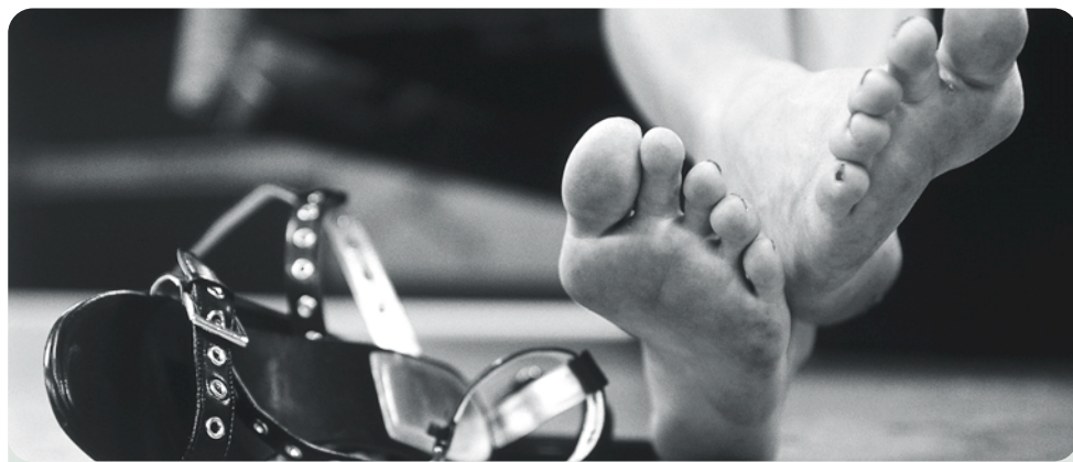
Rein genetisch „drückt der Schuh“ bei den Frauen um einiges mehr als bei den Männern - doppelt so viele Schmerzrezeptoren und Schmerz fördernde Hormone.