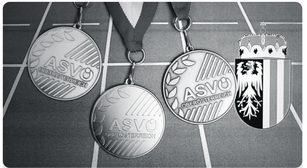
130 Mal waren die AthletInnen des ASVÖ Oberösterreich bei der Medaillenjagd erfolgreich, bundesweit hatte Kajak die Nase vorne, landesweit die Leichtathletik.

Best of the Best aus 2005 Über dreißig Staatsmeistertitel, mehr als hundert Landes-Champions - der ASVÖ Oberösterreich ist stolz und ehrt seine besten SportlerInnen des abgelaufenen Sportjahres.