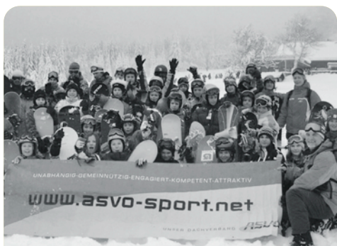
Einhellige Meinung: alle wollen auch nächstes Mal beim Boarder Camp dabei sein.

Mehr als vierzig Mädchen und Burschen sind zum bereits achten ASVÖ Snowboard Camp auf den Hochficht gekommen. 19 Anfänger, ein dutzend Fortgeschrittene und elf schon sehr gute Freestyler kamen auch heuer wieder zum Camp ins nördliche Mühlviertel, um einen „Slope Style Kurs“ zu bauen. Drei Camp-Tage mit jungen Leuten voller Elan und großem Engagement, trotz miserabelster Witterung. Schneefall, Nebel und Windböen als ständige Begleiter taten dem Spaß aller Beteiligten allerdings keinen Abbruch. Dank der guten Schulung und der Umsicht der Übungsleiter ging auch das heurige Snowboard Camp am Hochficht unfallfrei über die Bühne. Ganz nach dem Motto: „Gemeinsam lernt es sich leichter“, schafften alle Anfänger bis zum Kursende die Grundzüge des Boardens, die Fortgeschrittenen konnten an ihrer Technik feilen. Die guten Boarder standen ihre ersten Tricks über „Kicker, Rail und Straight Box“. Geschlossene Grundaussage nach dem Camp: eine tolle Veranstaltung und alle wollen beim neunten ASVÖ Snowboard Camp wieder dabei sein. Vor acht Jahren rief der Allgemeine Sportverband dieses Camp ins Leben und bietet für seine sportbegeisterten Kids jede Menge Spaß und Bildung mit Gleichgesinnten. Unterstützt haben die Veranstaltung die Sparkasse Mühlviertel und das Sporthaus Sport 2000 Niedersüß.