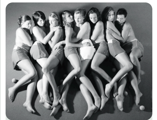
Da lacht das Männerherz - beim neuen Kalender der Pregartner Tennis Pinups.

Von Pirelli- bis Jungbauern-Kalender, viele haben es vorgemacht - „Das können wir auch!“ - dachten sich die Tennis-Ladies vom SV Pregarten und setzten es in einen „ansehnlichen Jahreskreis“ um. Die Damenmannschaft des Mühlviertler Tennisvereins hat für eine Sportförderung der besonderen Art - „dem Vereinskalendar 2006“ posiert. „Wir wollen heuer von der Landesliga in die OÖ Liga aufsteigen“, lautet der Tenor der feschten Ladies. Die Finanzierung für das intensive Training soll der Erlös aus dem Verkauf des Kalenders bringen. Zwölf Monate SV Pregarten Damen gibt es in einer limitierten Auflage von 500 Stück, Kostenpunkt á 10 Euro. Die Produktion hat figaro uno übernommen. Erhältlich ist der Pregartner Tenniskalender in jedem figaro uno Salon oder unter www.sv-pregarten-tennis.at