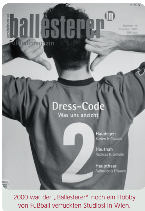
2000 war der „Ballesterer“ noch ein Hobby von Fußball verrückten Studiosi in Wien.

ballesterer fm durchleuchtet alles rund ums Leder seit mehr als fünf Jahren. Das ehemals studentische Kultblatt wagt jetzt den bundesweiten Schritt, auch in Oberösterreichs Trafiken.