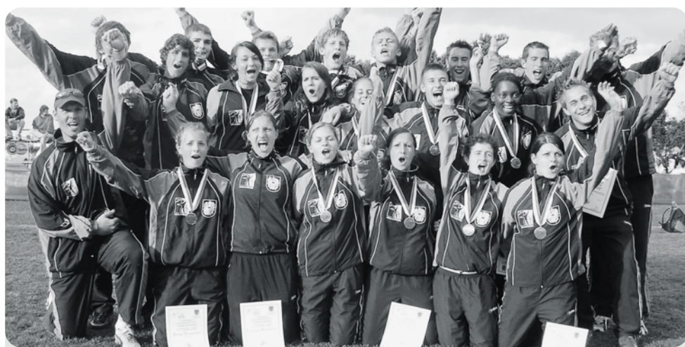
Auch wenn unsere Faustball Mädels und Burschen „nur“ zweimal bronzenes Edelmetall geschürft haben, Chile bleibt für den Nachwuchs ein unvergessliches Erlebnis.

16.000 Kilometer doppelt eine Reise wert. Große Erfolge bei Unter 18 Weltmeisterschaften vom vierten bis siebten Jänner in Chile. Bei Burschen und Mädchen jeweils dritter Platz. Irreguläre Verhältnisse in Llanquihue kosten beiden Teams die Finalteilnahme.