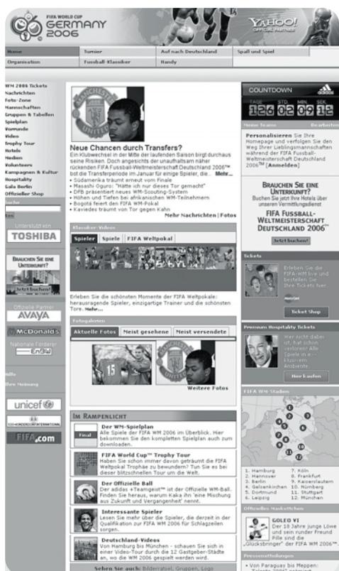
Die Fußball WM droht ein Fressen für die E-Mail Würmer von Hackern zu werden.

Die Werbewirtschaft ist 2005 gewachsen, zumindest in Deutschland. 19 Milliarden Euro betrug der Bruttowerbeaufwand in den klassischen Medien Deutschlands, ein Plus von gut fünf Prozent im Vergleich zum Vorjahr. Geht es nach den Marktforschern von Nielsen Media Research setzt sich das im WM-Jahr 2006 fort. Hier lie-